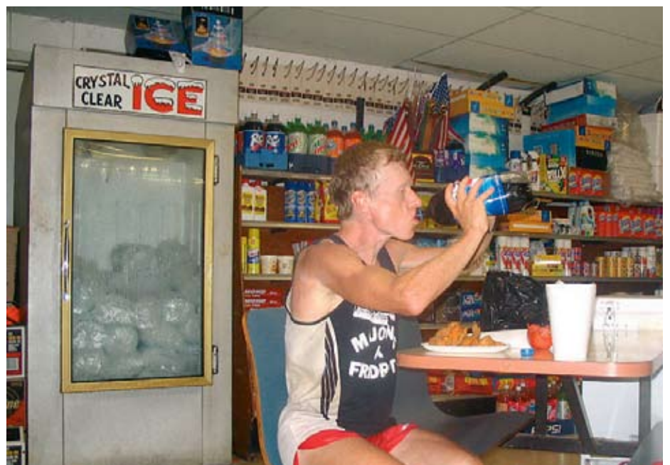
Bensinstationerna är efterlängta energidepåer.