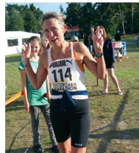
Artikelförfattaren var en av många nöjda semesterlöpare på Gotland.