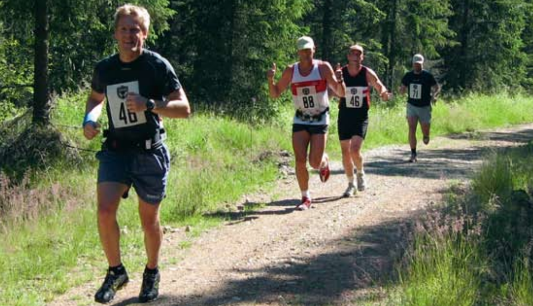
Glada löpare på väg.