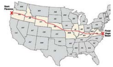
Från kust till kust, från Oregon till Virginia.

Visst är Iowa vackert men trots det var det inte delstaten jag gillade. Det var