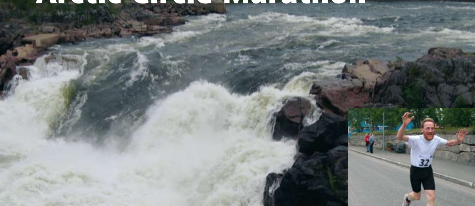
Det mäktiga Jockfall.