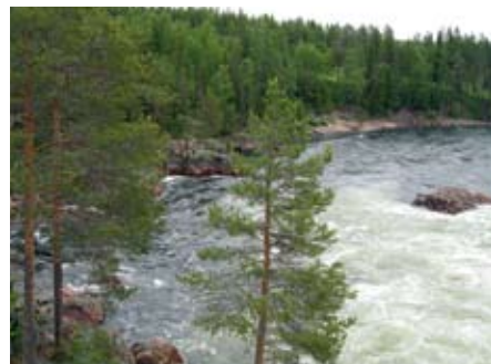
Arctic Circle Marathon sid 10

Eventuella frågor gällande prenumeration på tidningen Marathonlöparen mottages på e-post: medlemssekreterare@marathonsallskapet.se eller fragor@runnersworld.se tel: 08-54553530