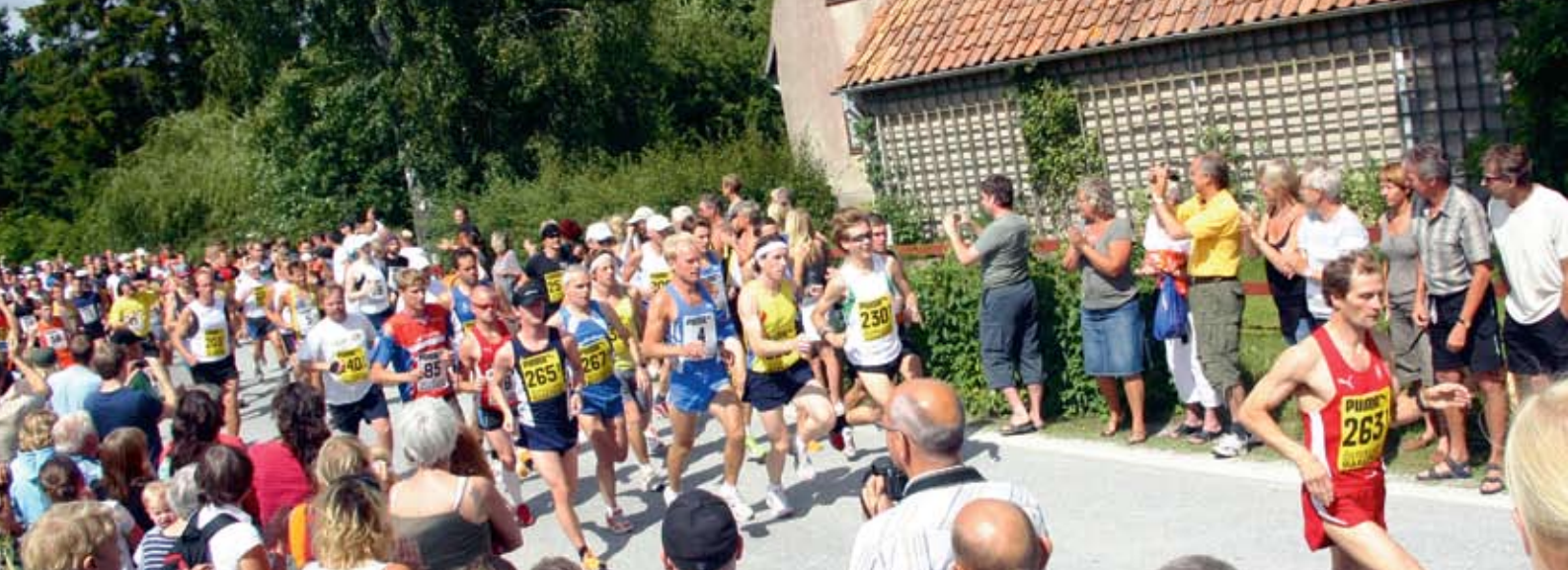
Starten har gått för det tionde Östergarn Marathon.