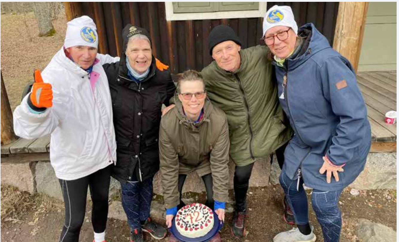
Födelsedagsjogg på Järvafältet i mars 2024, då Sällskapet fyllde 72 år.