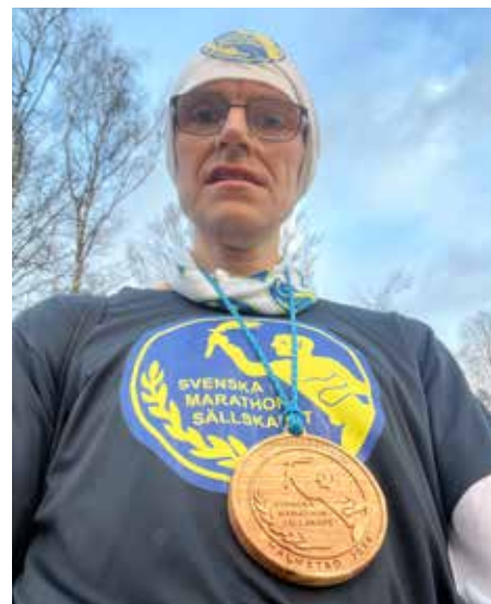
Redaktören efter Vintermarathon i Simlångsdalen.

Svenska Maratonsällskapet är en politiskt och religiöst obunden ideell förening. Sällskapet är öppet för alla.