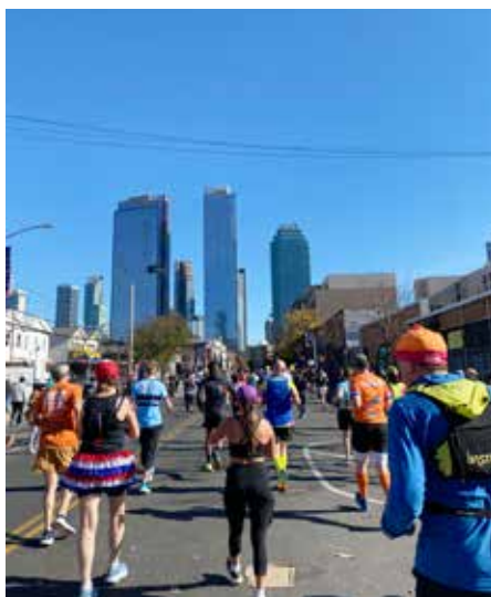
Lång raksträcka med mäktiga skyskrapor i förgrunden.

Strax efter halvmaran springer vi över bron från Brooklyn till Queens. Den är betydligt mindre än Verrazzanobron; ungefär lika lång som den bro vi startade på är hög, och åskådarnas skyltar med texten "Welcome to Queens" är en tyd-