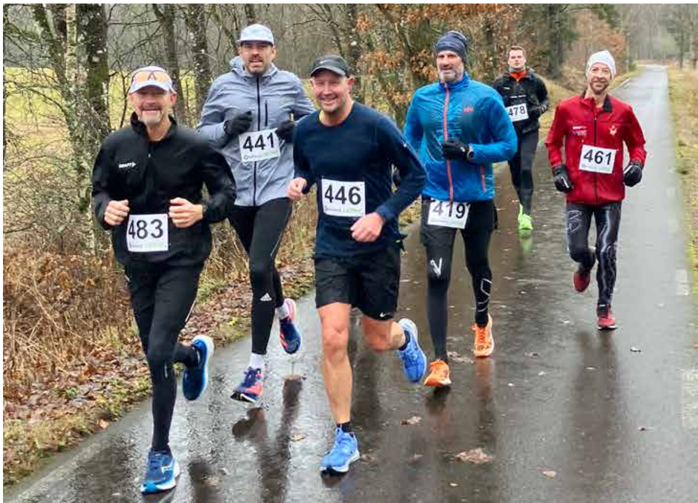
En klunga glada löpare längs med banvallen.