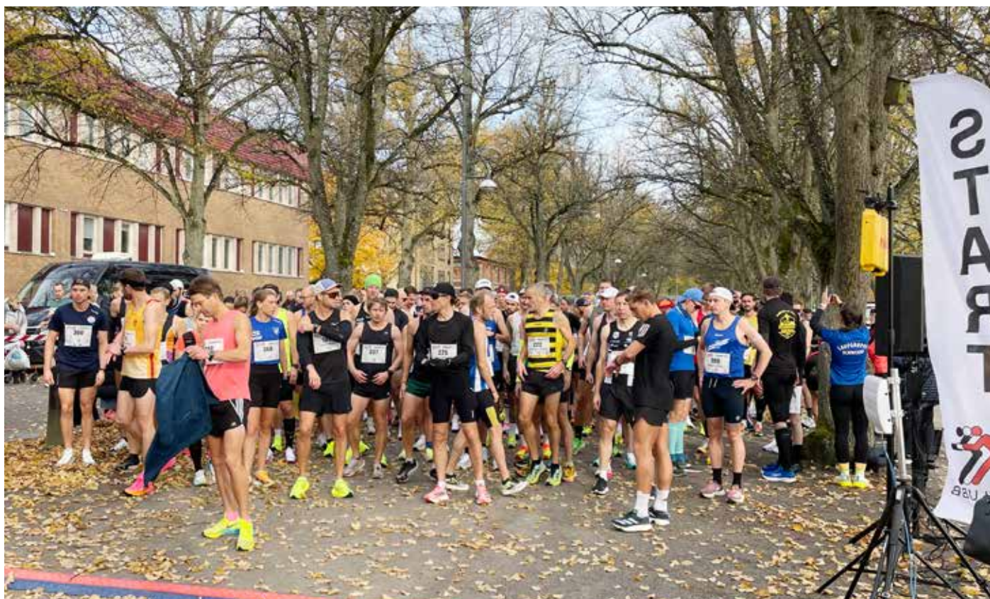
Förväntan i luften minuten före start utanför Centrallasarettet i allén.