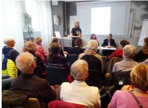
Sällskapets årsstämma 2024.