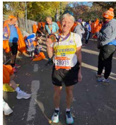
Artikelförfattaren med stor och tung medalj runt halsen.