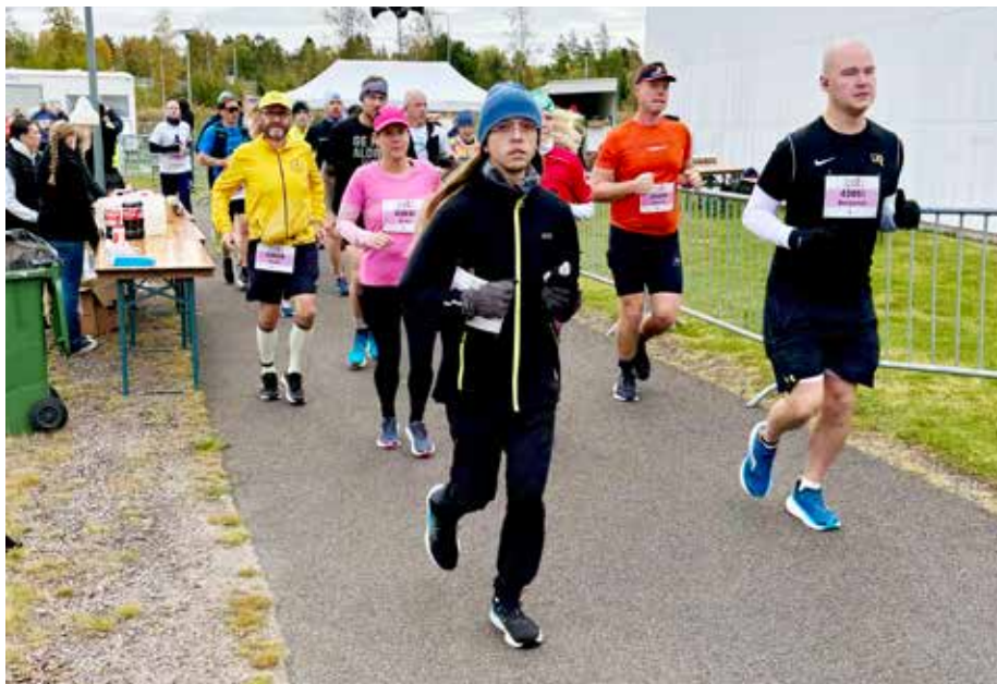
Fokuserade löpare vid en vätskekontroll.

Jag sprang i mål på 5:59:20 till publikens jubel och kände mig också som en vinnare.