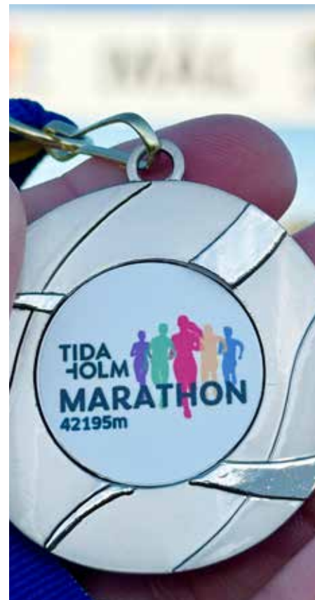
Loppets fina medalj.