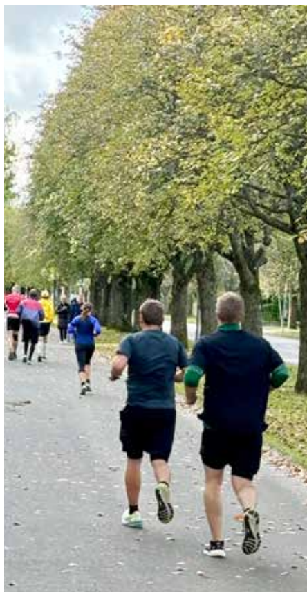
Löpare på en gång- och cykelväg längs med banan.