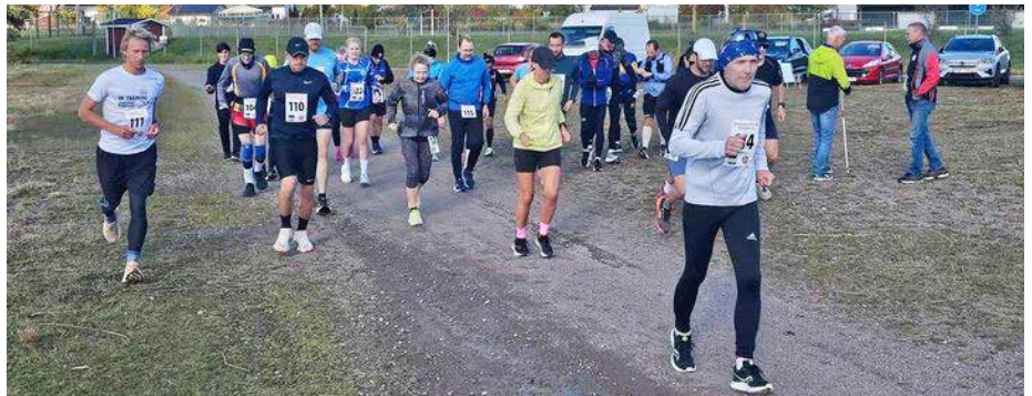
Starten har gått för det 3:e 6,7 km långa varvet.

Efter 1,5 kilometer är vi tillbaka vid starten. Resten av banan går på en grusad gångväg längs med Hulingen. Efter drygt fyra kilometer vänder vi och via 25 meter på en stig med högt gräs (banans enda trailparti) springer vi samma väg tillbaka till hembygdsparken. Banan är således mycket flack och lättsprung.