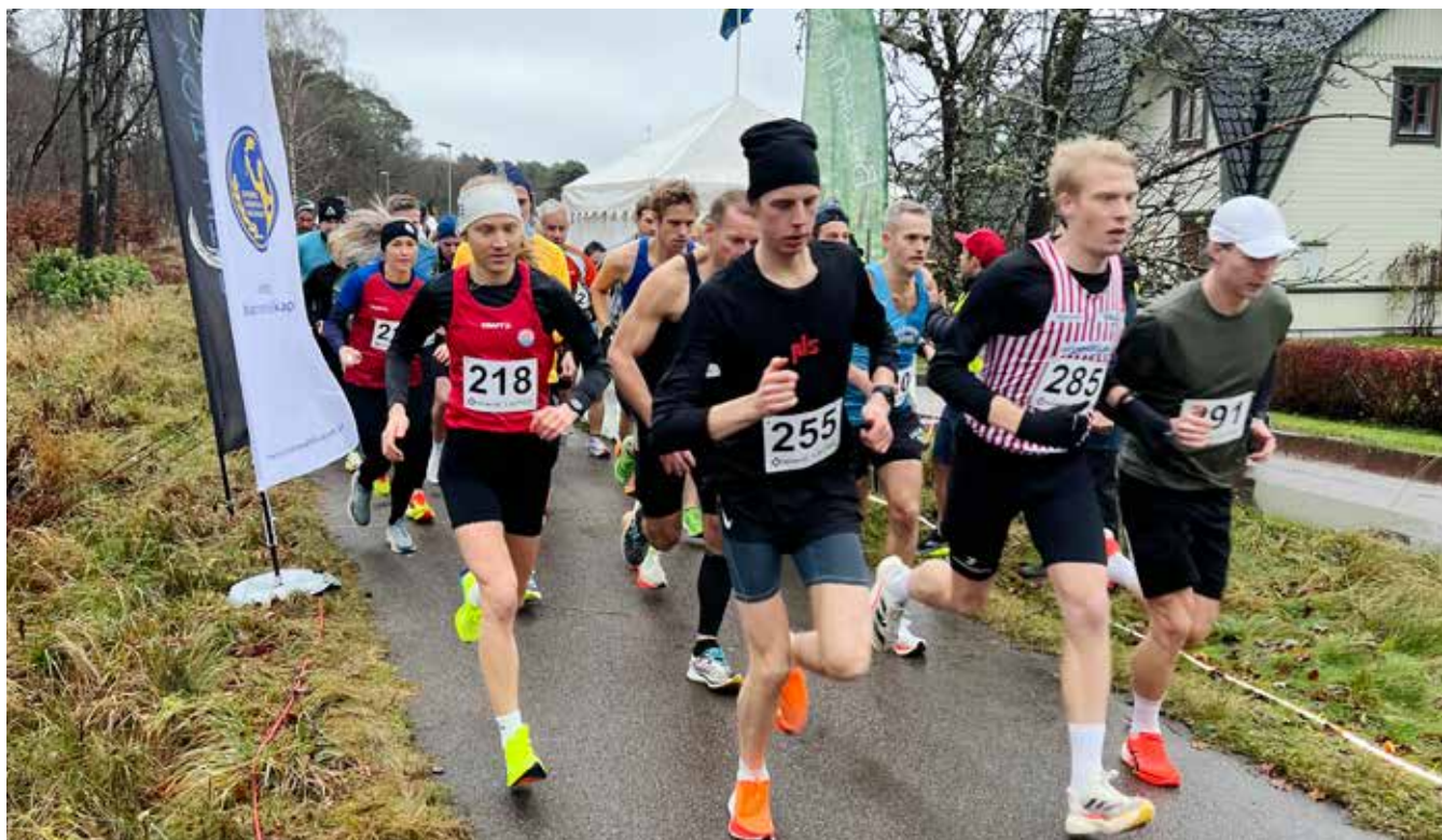
Vintermarathon i Simlångsdalen utanför Halmstad 16 november 2024.