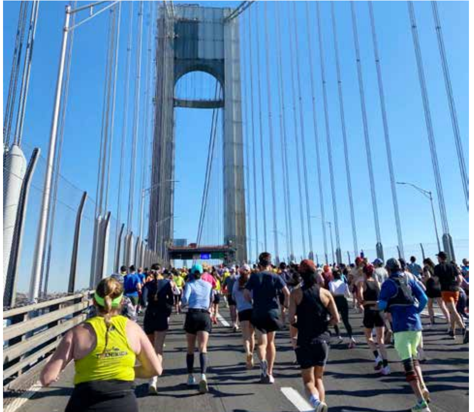
Löpning över Verrazzanobron direkt efter starten.

JAG LANDADE på torsdagskvällen innan loppet och kom ut på ett Manhattan som var underbart varmt och fyllt av ljud, neonljus och utklädda människor. Jag hade hamnat rakt i halloween-firandet – en perfekt start på min veckolånga vistelse i The Big Apple!