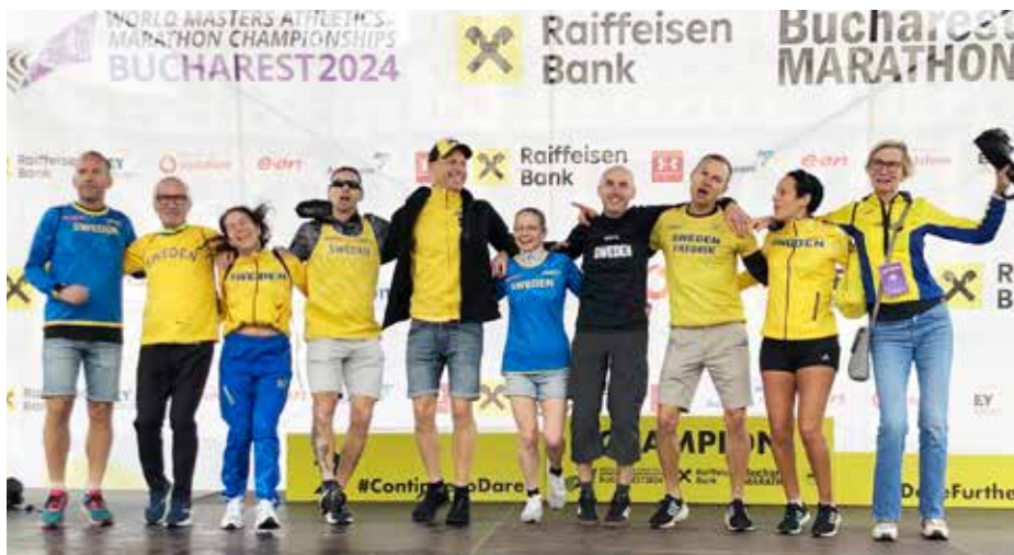
Sveriges tur att släppa loss på invigningen.

Söndagen den 13 oktober avgjordes veteran-VM i maraton i samband med Raiffeisen Bank Bucharest Marathon. Vi var 13 svenska veteraner som kom till start med yngste deltagare i M40 och äldste i M80-klassen. Som veteran tävlar man i femårsklasser från 35 år och uppåt. Totalt var drygt 400 veteraner anmälda, vilket är en hög siffra jämfört med förr när maraton var en del av världsmästerskapen i arenafriidrott. Just på grund av det låga deltagarantalet och komplexiteten av att arrangera ett maraton, togs beslutet av World Masters Association (WMA) att istället erbjuda redan etablerade lopp att arrangera mästerskapet.